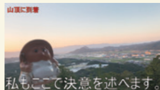
#3 喜美子が大阪に行く決意を行った場所を紹介します。