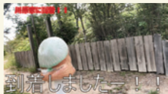
#2 川原家の門までのアクセスを紹介します。