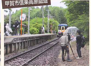
甲賀市信楽高原鉄道