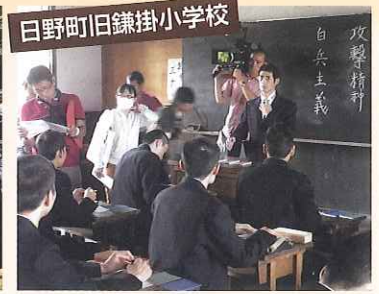
日野町日鎌掛小学校