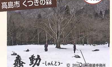
高島市 くつきの森

水口や石部等でも撮影され、殺陣 のシーンは、くつきの森で撮影されま した。実際に雪が積もる季節を狙って の撮影ですから、リアリティのある時 代劇になりました。