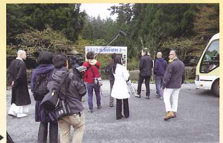
比叡山延暦寺にて▶