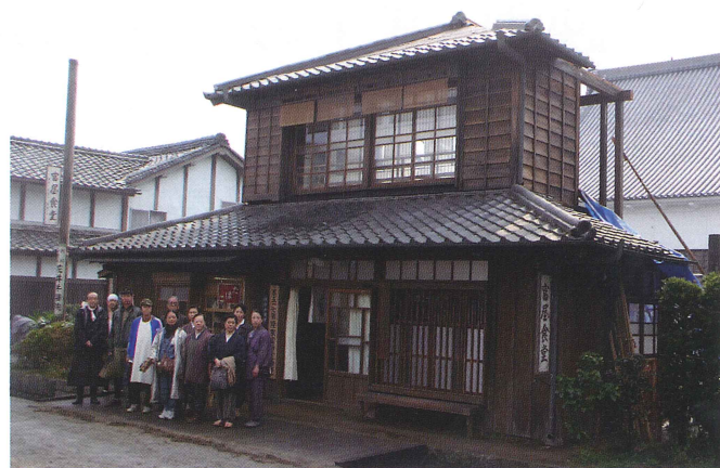
五個荘に『富屋食堂』が現れました。