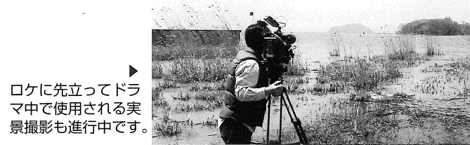
ロケに先立ってドラマ中で使用される実景撮影も進行中です。