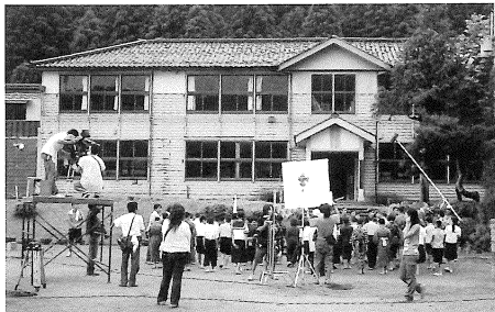
町民の皆さんが見守るなかロケが行われました。