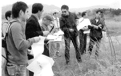
現場でも入念な打ち合わせが何度も繰り返されました。

2006年のNHK大河ドラマが司馬遼太郎さん原作「功名が辻」に決定後、脚本家の大石静さんがシナハン(※1)で来県され、メインスタッフも県内各地でロケハン(※2)を重ね、8月下旬に迫った県内ロケの準備もいよいよ大詰めを迎えています。オフィスではドラマ決定を受けて、これまで関