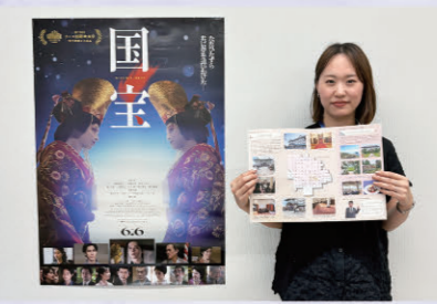
滋賀ロケ地マップと関西広域ロケ地マップの2種類のマップを制作