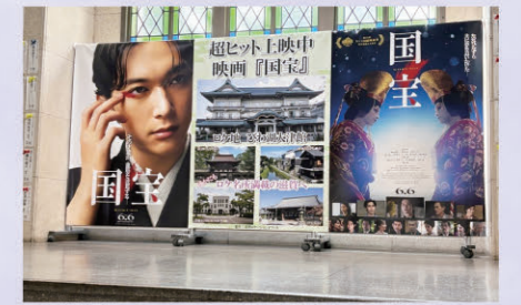
滋賀県庁本館にフォトスポットを設置

このたび、映画『国宝』に関して「ロケーションジャパン大賞グランプリ」という大変名誉ある賞をいただき、誠にありがとうございます。本作品を通じて、滋賀の歴史や文化、そして豊かな自然の美しさを全国の皆さまに届けたいことを、心から感謝申し上げます。この受賞は、映画制作に携わられた皆さまの御尽力はもちろんなこと、地域の皆さまをはじめとする滋賀の魅力を感じてくださる皆さまの御協力のおかげです。改めて、深く感謝申し上げます。 映画『国宝』のロケがびわ湖大津館と滋賀県立総合病院で行われたのは、2024年4月でした。細部まで入念かつ丹誠で作られた美術装飾や、監督、キャスト、スタッフの皆様の撮影にかけられる熱意のすさまじさは、映画史に残る大傑作の制作現場にまさにふさわしいものでした。 当オフィスでは、映画の公開に合わせて積極的なプロモーションを実施。2種類のロケ地マップやオリジナルポスターの制作、県庁やびわ湖大津館にフォトスポット等を設けるなどの取組を行いました。おかげさまで県内外から大勢の方々と同館にお越しいただくことができ感謝しております。 滋賀県は、びわ湖の豊かな自然や歴史の景観を生かし、映画ドラマなどの映像作品の誘致・支援を通じて「ロケの聖地」を目指しています。今後も、ロケ地としての魅力をさらに高め、ロケ地の活性化と観光振興につなげてまいります。そして、映画やドラマを通じて、滋賀の魅力がより多くの方々に届くよう、全力で取り組んでまいりますので、引き続きよろしくお願いたします。