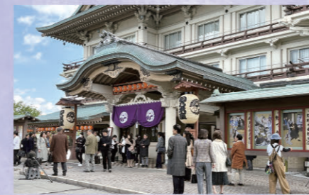
約200人のエキストラを動員して実施されたびわ湖大津館ロケ