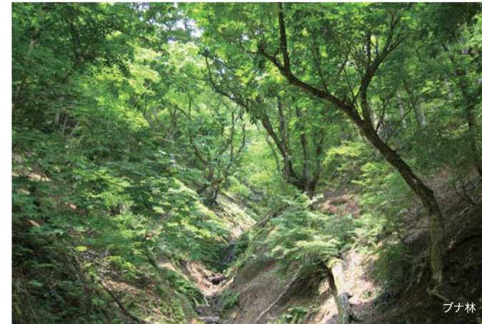
Beech Grove 너도밤나무 숲 山毛榉林 山毛榉林