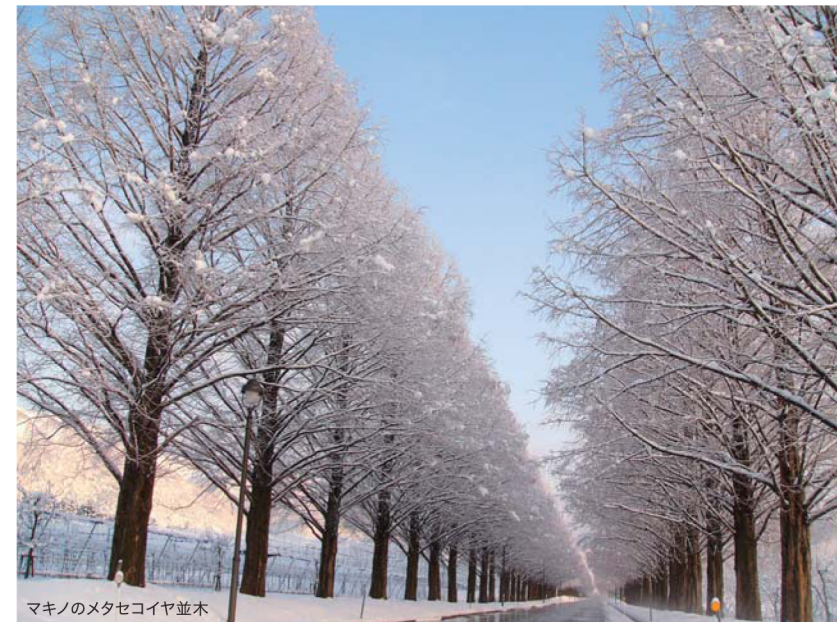
マキノのメタセコイヤ並木