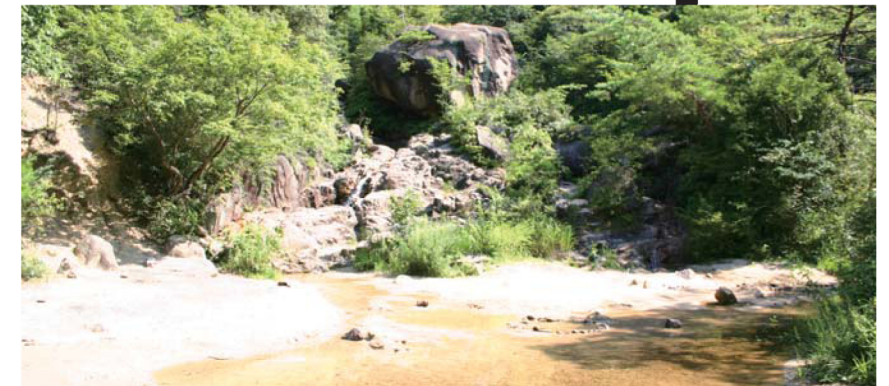
天神川 Tenjin River 덴진가와 강 天神川 天神川