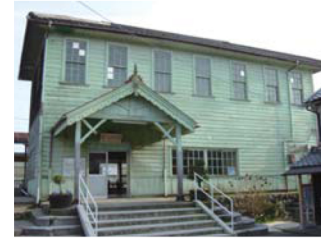
Shin-Yokaichi Station 신요카이치 역 新八日市站 新八日市站