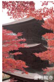
Kongourinji Temple 곤고린지 절 金刚轮寺 金刚轮寺