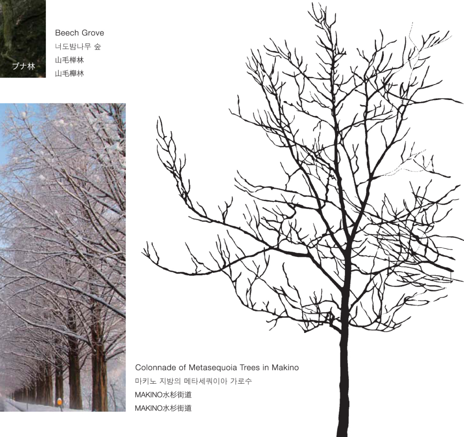
Colonnade of Metasequoia Trees in Makino 마키노 지방의 메타세쿼이아 가로수 MAKINO水杉街道 MAKINO水杉街道