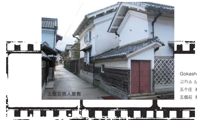
Gokasho Merchant Homes 고카쇼 상인지택 五个庄 商人府邸 五個莊 商人府邸